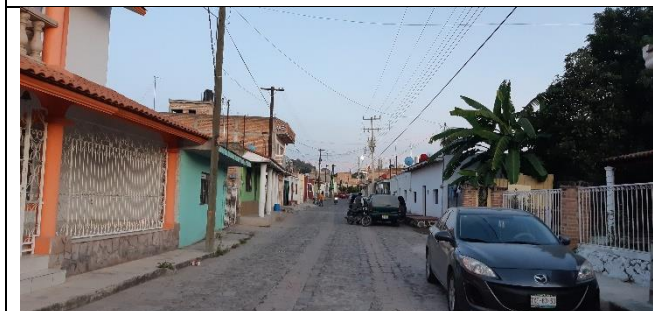
PAVIMENTACION DE LA CALLE CUAHUTEMOC