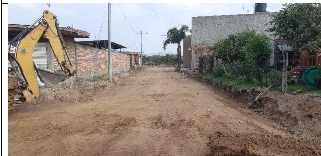
PAVIMENTACION DE LA CALLE PRIVADA SANTA TERESITA