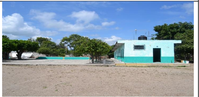
REHABILITACION DE EN LA ESCUELA PRIMARIA ELÍAS NANDINO VALLARTA CCT 14DPR3182T