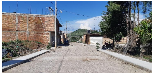
PAVIMENTACION DE LA CALLE PRIVADA LUIS OROZCO