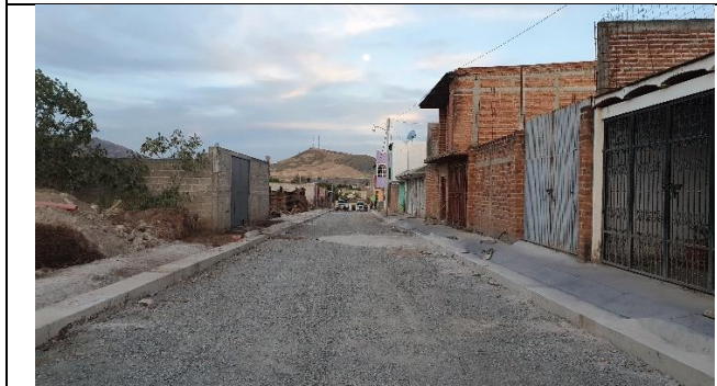
PAVIMENTACION DE LA CALLE PROLONGACION DE LA BRIGADA