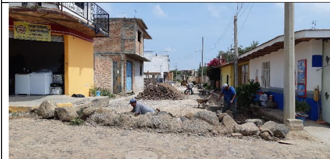
PAVIMENTACION DE LA CALLE LUIS OROZCO