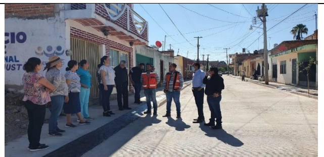
PAVIMENTACION DE LA CALLE CUAHUTEMOC