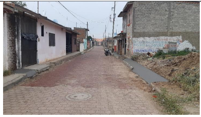
CALLE PENSADOR MEXICANO EN LA DELEGACION DE SANTA CRUZ DEL ASTILLERO