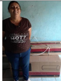
ENTREGA DE CALENTADORES SOLARES EN LA COLONIA DE LOS SAUCES