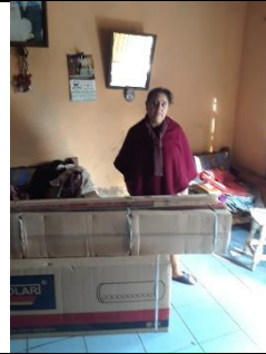
ENTREGA DE CALENTADORES SOLARES EN LA CALLE PENSADOR MEXICANO