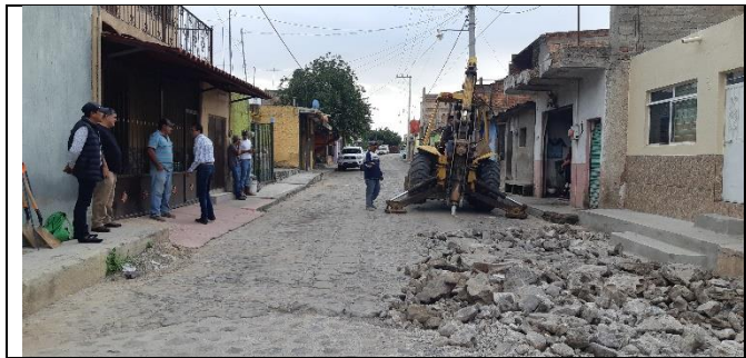
CALLE MEDINA ASENCIO EN LA DELEGACION DE HUAXTLA