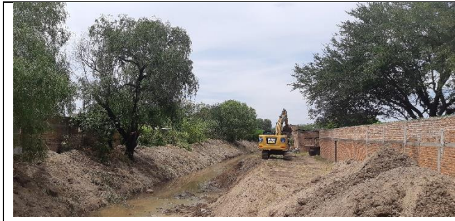
DEZALSOLVE DEL ARROYO EL ARENAL