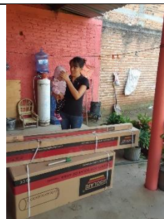
ENTREGA DE CALENTADORES SOLARES EN LA COLONIA DE LAS NORIAS