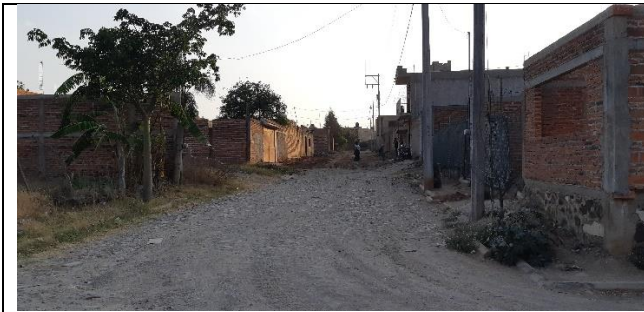
PAVIMENTACION DE LA CALLE PRIVADA LUIS OROZCO