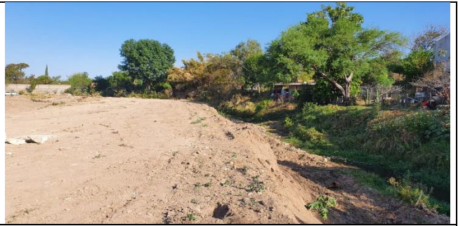
REHABILITACIÓN DEL COLECTOR SANITARIO EN LA DELEGACION DE SANTA CRUZ DEL ASTILLERO