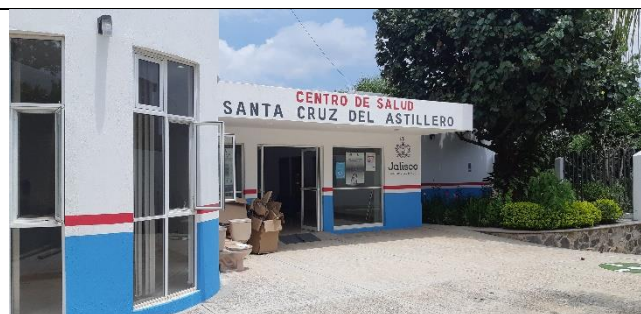
REHABILITACIÓN DEL CENTRO DE SALUD EN LA DELEGACION DE SANTA CRUZ DEL ASTILLERO