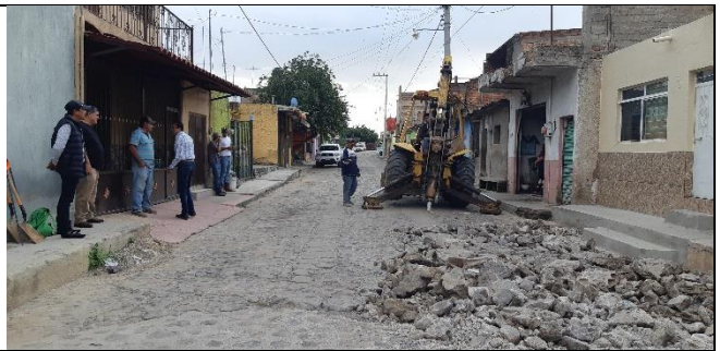
CALLE MEDINA ASENCIO DELEGACION DE HUAXTLA