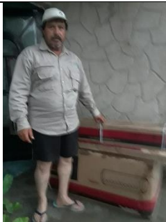
ENTREGA DE CALENTADORES SOLARES EN LA COLONIA LOS SAUCES