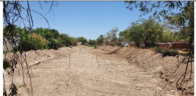
DEZALSOLVE DEL ARROYO EL ARENAL