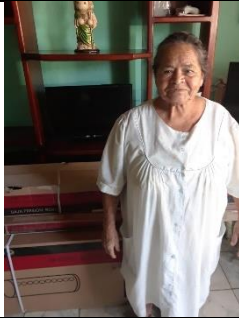
ENTREGA DE CALENTADORES SOLARES EN LA CALLE PENSADOR MEXICANO