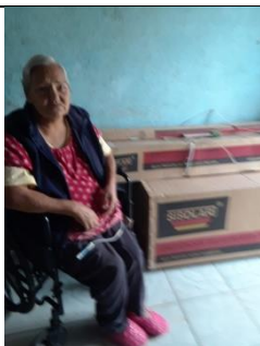
ENTREGA DE CALENTADORES SOLARES EN LA COLONIA DE LAS NORIAS