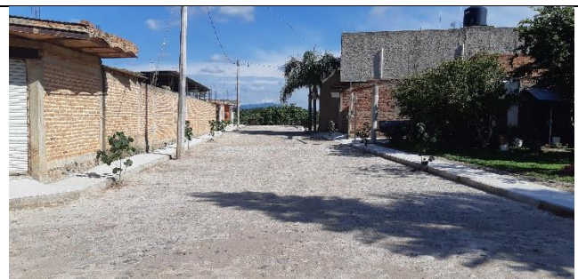
PAVIMENTACION DE LA CALLE PRIVADA SANTA TERESITA