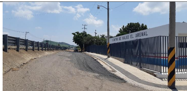
REHABILITACIÓN DEL CENTRO DE SALUD EL ARENAL