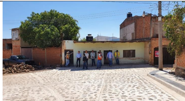
PAVIMENTACION DE LA CALLE PROLONGACION DE LA BRIGADA