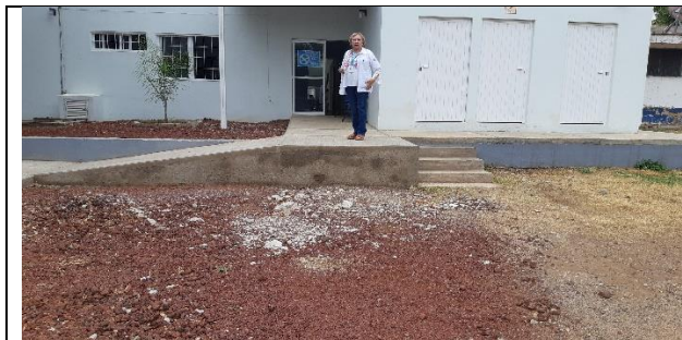
REHABILITACIÓN DEL CENTRO DE SALUD EL ARENAL