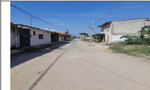
CALLE PENSADOR MEXICANO EN LA DELEGACION DE SANTA CRUZ DEL ASTILLERO