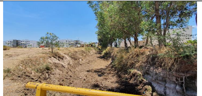
DEZALSOLVE DEL CANAL DEL FRACCIONAMIENTO LA CIMA