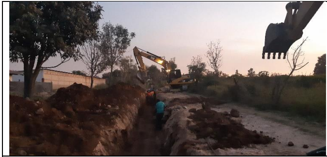
REHABILITACIÓN DEL COLECTOR SANITARIO EN LA DELEGACION DE SANTA CRUZ DEL ASTILLERO