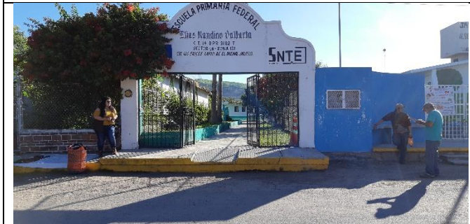
REHABILITACION DE EN LA ESCUELA PRIMARIA ELÍAS NANDINO VALLARTA CCT 14DPR3182T