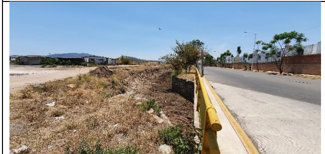
DEZALSOLVE DEL CANAL DEL FRACCIONAMIENTO LA CIMA